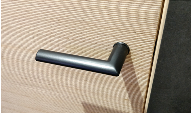
Kuvassa Spirit-ovi teknisellä viululla toteutettuna. Painikkeena HOPPE Stockholm minirose-painike. Koivukarmista näkyviin jää 5 mm.